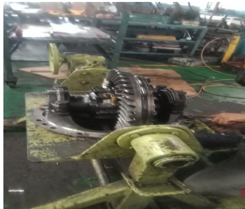
Gambar 5. Setelah dipasang pada stand differential