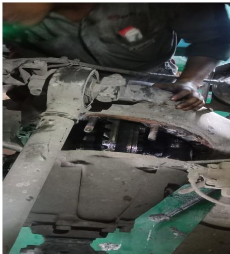
Gambar 1. Pelepasan differential