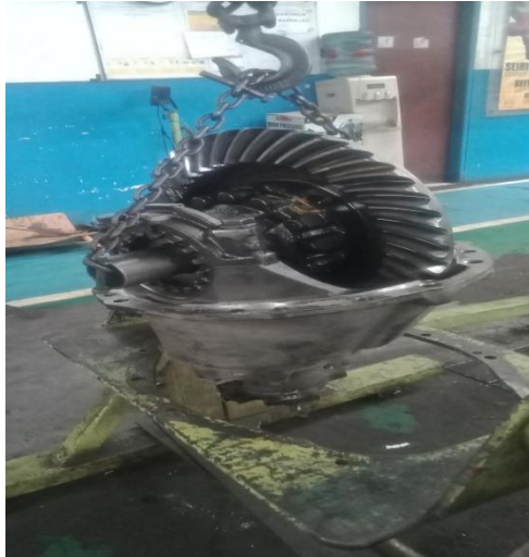
Gambar 4. Differential diangkat menggunakan alat hidrolis dan memasang pada stand differential