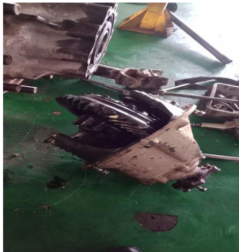
Gambar 3. Setelah turun dari chassis kendaraan